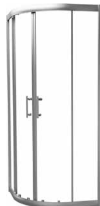
Kabina SYMFONIA półokrągła, profil srebrny, wysoki połysk - chrom

Halfround enclosure SYMFONIA silver profiles - chrom