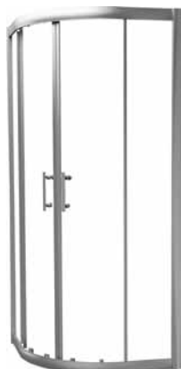
Kabina SYMFONIA półokrągła, profil srebrny, wysoki połysk - chrom

Halfround enclosure SYMFONIA silver profiles - chrom