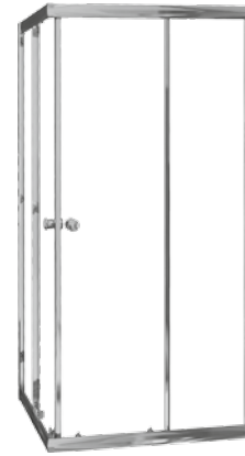
Kabina TOSCANA kwadratowa, profil srebrny, wysoki połysk - chrom

Square enclosure TOSCANA silver profiles - chrom