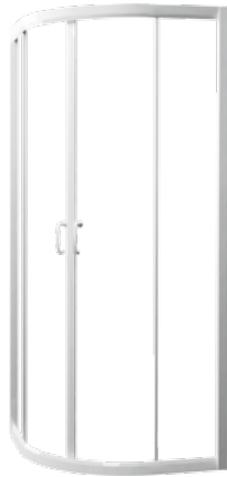
Kabina CARMEN NEW półokrągła, profil biały

Halfround enclosure CARMEN NEW white profiles