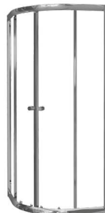
Kabina TESALIA półokrągła, profil srebrny, wysoki połysk - chrom

Halfround enclosure TESALIA silver profiles - chrom Кабина полукруглая TESALIA серебристый профиль - chrom