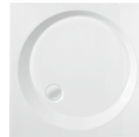
Brodzik kwadratowy VIKING Square shower try VIKING Поддон квадратный VIKING 80x80x8, 90x90x8