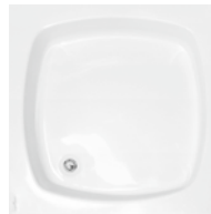
Brodzik kwadratowy Square shower try Поддон квадратный 80x80x6, 80x80x16, 90x90x6, 90x90x16