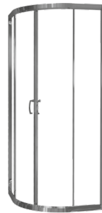
Kabina CARMEN NEW półokrągła, profil srebrny, wysoki połysk - chrom

Halfround enclosure CARMEN NEW silver profiles - chrom