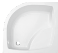
Brodzik półokrągły z siedziskiem Halfround shower try with sit Поддон полукруглый с сиденьем 80x80x30, 90x90x30

Zintegrowany z panelem Integrated with casing Интегрированный с панелью