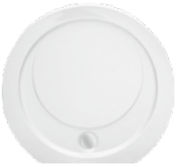
Brodzik okrągły OLIMPIA Round shower try OLIMPIA Поддон круглый OLIMPIA 100x4

Zintegrowany z panelem Integrated with casing Интегрированный с панелью