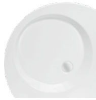
Brodzik wycinek koła VIKING Shower try VIKING - circle section Поддон VIKING - сектор круга 80x80x8

Zintegrowany z panelem Integrated with casing Интегрированный с панелью