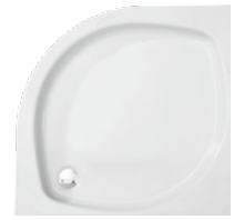
Brodzik półokrągły Halfround shower try Поддон полукруглый 80x80x6, 90x90x6

Zintegrowany z panelem Integrated with casing Интегрированный с панелью