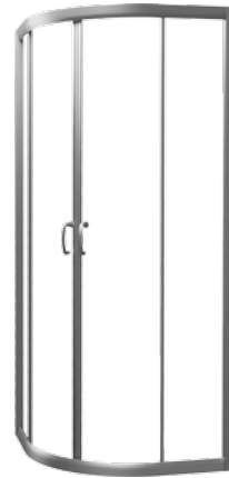
Kabina CARMEN NEW półokrągła, profil srebrny, matowy - anoda

Halfround enclosure CARMEN NEW silvermatt profiles - anoda