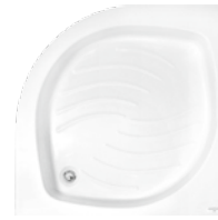
Brodzik półokrągły Halfround shower try Поддон полукруглый 80x80x6, 80x80x16 90x90x6, 90x90x16

Zintegrowany z panelem Integrated with casing Интегрированный с панелью