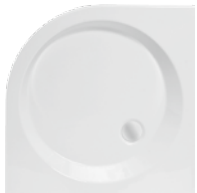
Brodzik półokrągły VIKING Halfround shower try VIKING Поддон полукруглый VIKING 80x80x6, 90x90x6

Zintegrowany z panelem Integrated with casing Интегрированный с панелью