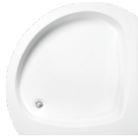
Brodzik wycinek koła Shower try - circle section Поддон - сектор круга 80x80x16

Zintegrowany z panelem Integrated with casing Интегрированный с панелью